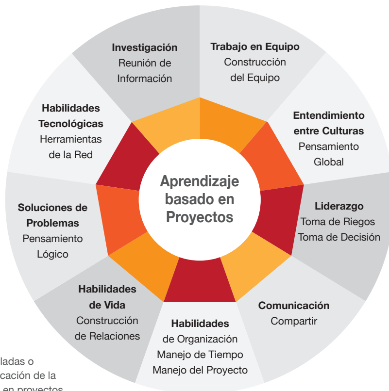
Gráfico 1: Habilidades desarrolladas o potenciadas por aplicación de la metodología basada en proyectos.